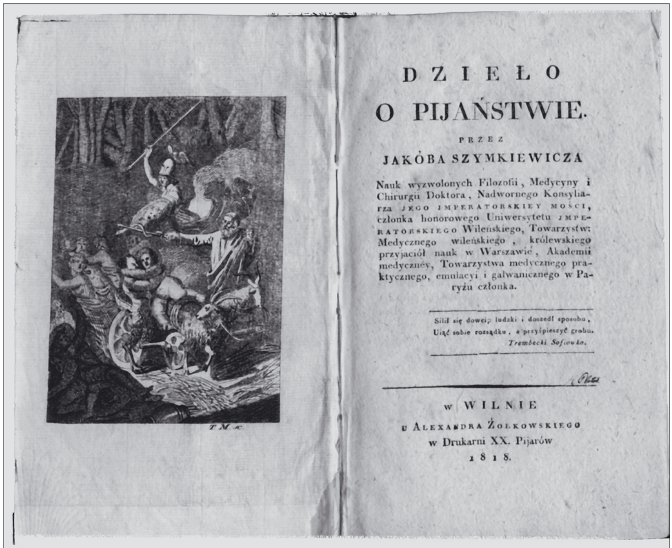
4 pav. Knygos „Veikalas apie girtuoklystę“ (1818 m.) titulinis puslapis su prielapio graviūra