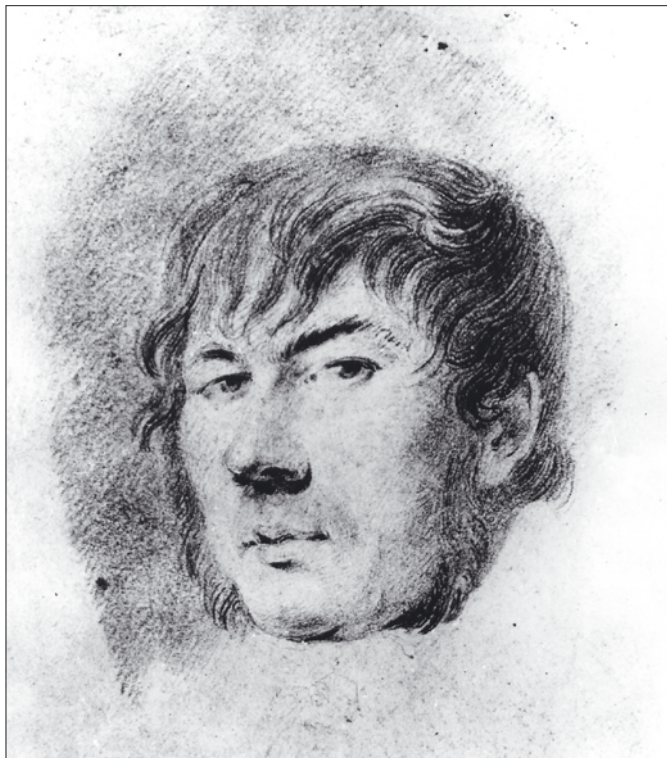
1 pav. Jokūbas Šimkevičius (1775–1818)